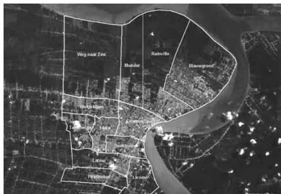
Paramaribo met indeling naar ressort

Etnische clustering in Paramaribo nam in de periode 1950-1992 af. Volgens de volkstelling van 1950 was Paramaribo overwegend Creools (71 procent) en tot deze groep werd minimaal de helft van de bevolking in iedere stedelijke sectie gerekend. De gegevens van de volkstelling van 1964 werden gepresenteerd op het niveau van telgebieden, die beduidend kleiner waren dan de secties van 1950. In 1964 behoorde in 33 van de 38 telgebieden minstens 45 procent van de bevolking tot dezelfde etnische groep, voornamelijk de Creoolse. In 1992 was de helft van de woonbuurten in Paramaribo etnisch gemengd (Schalkwijk & De Bruijne, 1999). Hindostaanse buurten vond men vooral in het zuiden en westen van de stad en sterk Creoolse wijken in het zuiden en in de binnenstad. Marrons woonden vooral in Paramaribo-Zuid. De gegevens van de volkstelling uit 2004 zijn alleen beschikbaar op ressortniveau zodat helaas geen uitspraken op buurtniveau gedaan kunnen worden. Paramaribo kent twaalf ressorts met een bevolking variërend tussen 10.000 en 30.000 inwoners.