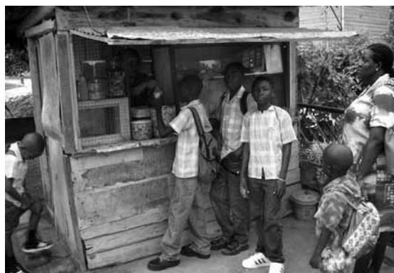
Schoolkinderen op de Nieuw Weergevondenweg

De bovengenoemde situatie is het gevolg van verschillende trends die ervoor zorgen dat in Paramaribo weinig wordt verhuisd. Uit de enquête van 2008 bleek dat tweederde van de respondenten nooit (20 procent) of slechts één keer (45 procent) in zijn leven verhuisde, en dat in de periode tussen 1985 en 2000 nauwelijks werd verhuisd. Precies hierin ligt de verklaring waarom Paramaribo minder sociaal-economisch gesegregeerd is dan andere Caribische steden. Sociaal-economische verschuivingen op huishoudniveau die zich vanaf 1980 voortdeden leidden niet tot verhuizingen en daardoor sociaal-economische (her)clustering, maar juist tot sociaal-economische heterogeniteit in woonwijken. Drie ontwikkelingen in de afgelopen dertig jaar zijn hiervoor verantwoordelijk: de economische crisis tussen 1980 en 2000, ontwikkelingen in de grond- en woningmarkt en de sociale kwaliteit van buurten.