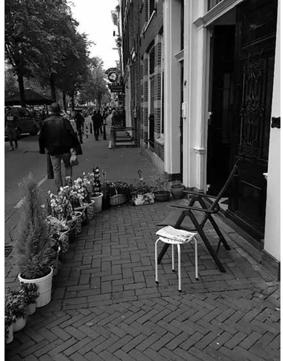
Figuur 2 Tactiek om de publieke ruimte toe te eigenen

Een andere bewoner ervaart het probleem van de drukte in een handeling die voor Amsterdammers centraal staat in hun alledaagse leven: fietsen. Hij vertelt dat de binnenstad steeds autoluwer wordt, waardoor toeristen de stad als voetgangersgebied beleven: "Het straalt een toegankelijke sfeer uit en tegelijkertijd zorgt het ook voor een specifiek soort drukte: mensenmassa's die allemaal weer even verbaasd zijn dat je met de fiets er doorheen wilt" (bewoner, 28 oktober 2014). Tijdens de zomermaanden van 2010 en 2011 ontwikkelt deze bewoner een creatieve tactiek om in de massa te manoeuvreren: "Een fluitje had ik dan om