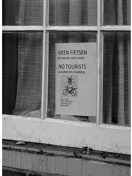
Figuur 3 Omgaan met overlast van toeristen

Om burgers te betrekken bij beleid gebruikt de gemeente verschillende strategieën. Deze geïnstitutionaliseerde momenten voor inspraak bieden een uitlaatklep voor ervaringen van overlast. Zo is er de klachtenlijn van de gemeente waar bewoners via internet of telefoon overlast kunnen melden. Een buurtbewoner ziet echter een paradox: “Dan zeggen ze bijvoorbeeld, ‘wilt u zoveel mogelijk bellen want dan kunnen we er een zaak van maken, en dan kunnen we dat opbouwen’. En dan bel je een paar weken later, en dan krijg je iemand anders, ‘wilt u niet zo vaak bellen