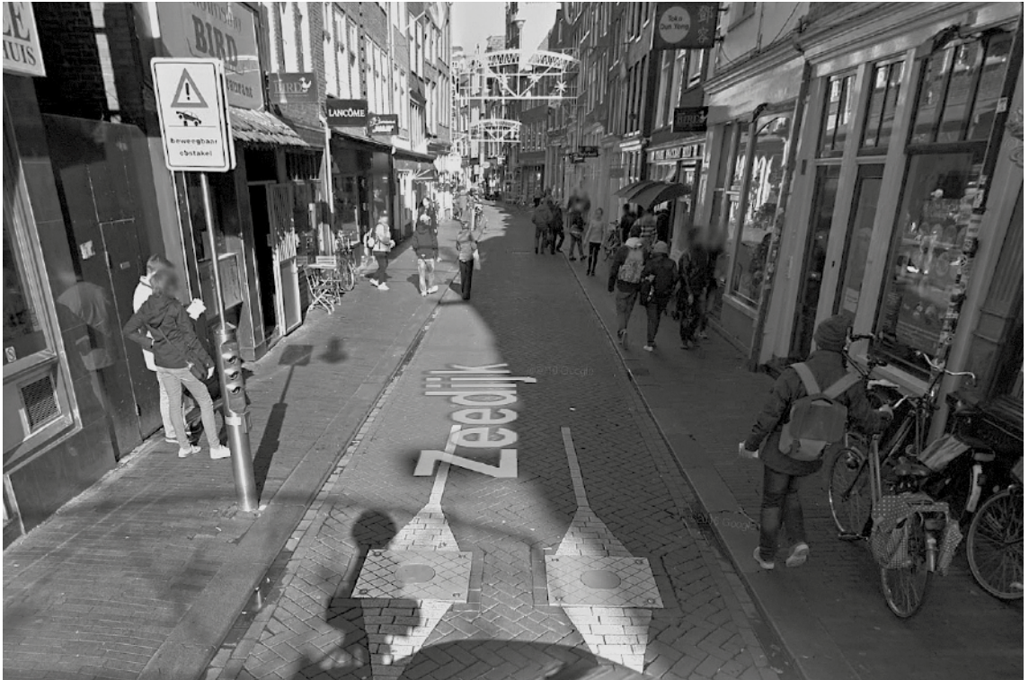
Beweegbaar opstapel (bron: Google streetview)

mende criminele infrastructuur in het postcodegebied 1012 te doorbreken en het gebied economisch te verbeteren. Tussen 2007 en 2014 worden vele bordelen gesloten, vastgoed wordt door de gemeente opgekocht en er wordt integraal gewerkt aan veiligheid, leefbaarheid en sociale cohesie (Gemeente Amsterdam, 2014). Een belangrijke pijler van het project is het opwaarderen van de wijk door zogenoemde laagwaardige economische functies – zoals coffeeshops, sekswinkels en minisupermarkten – te transformeren in kwalitatieve en hoogwaardige functies – zoals hippe horeca, kunstateliers en chocolaterie. Deze plannen zijn inmiddels doorgevoerd en de gemeente Amsterdam komt in de voorgangsrapportage (2014) tot de conclusie dat bewonersaantallen zijn gestegen