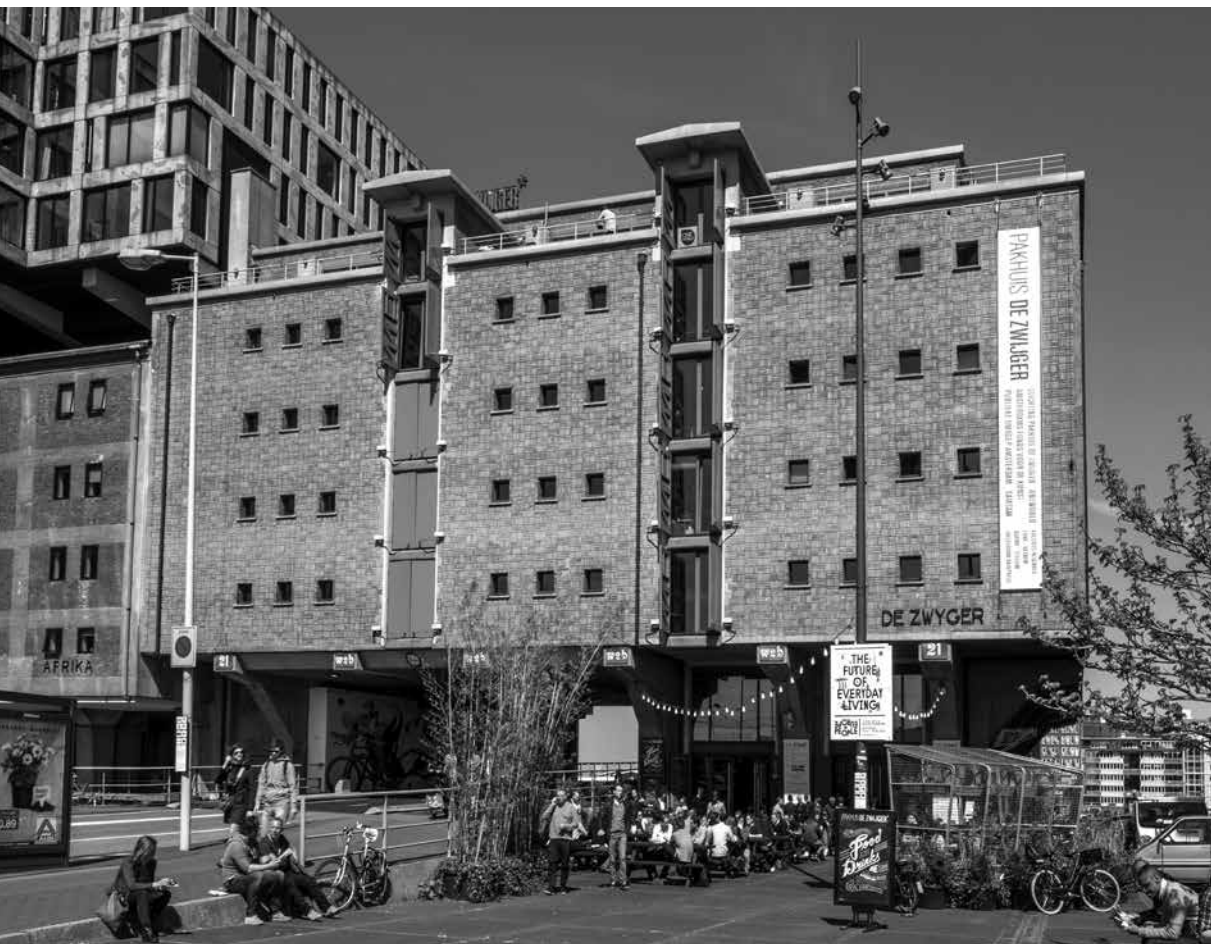
De Zwijger recent.