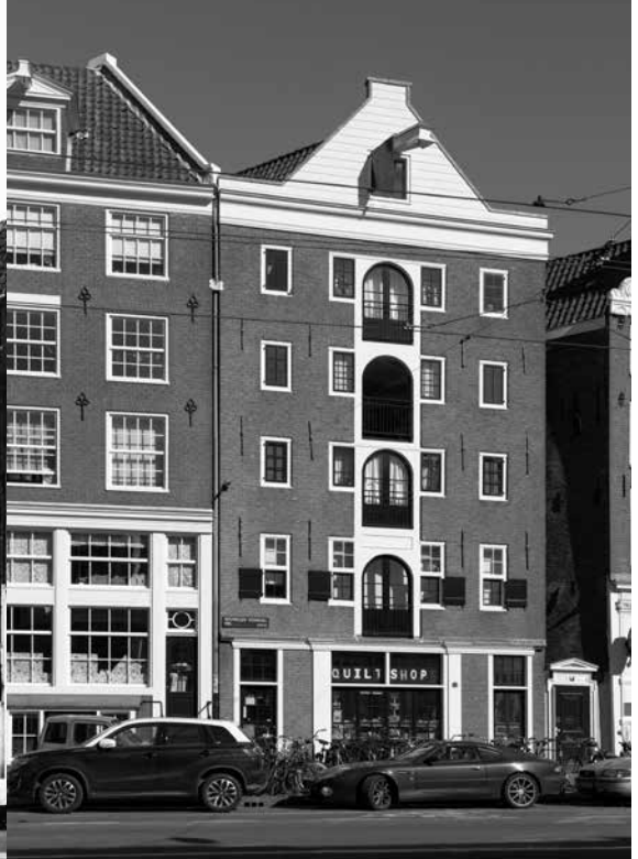
Nieuwezijdsvoorburgwal 97-99 in 2016.

“Wat is jouw persoonlijke motivatie geweest om in dit vakgebied te werken?”