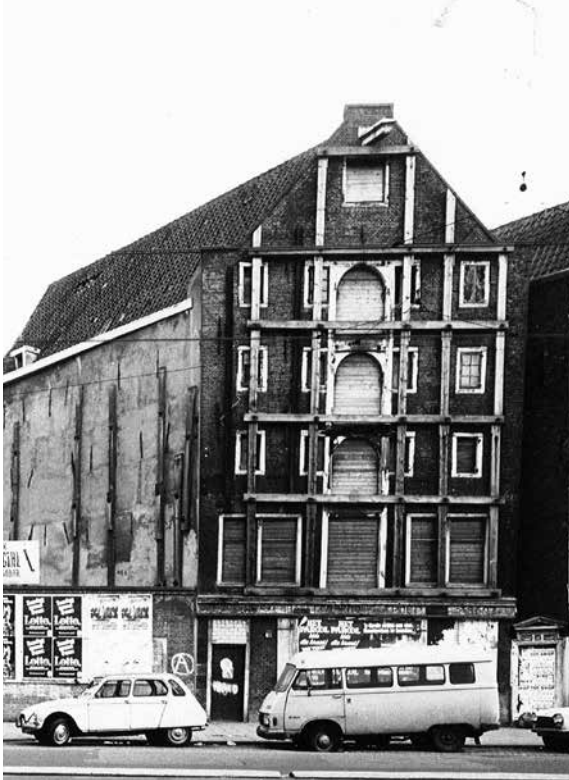
Nieuwezijdsvoorburgwal 97-99 voor renovatie.