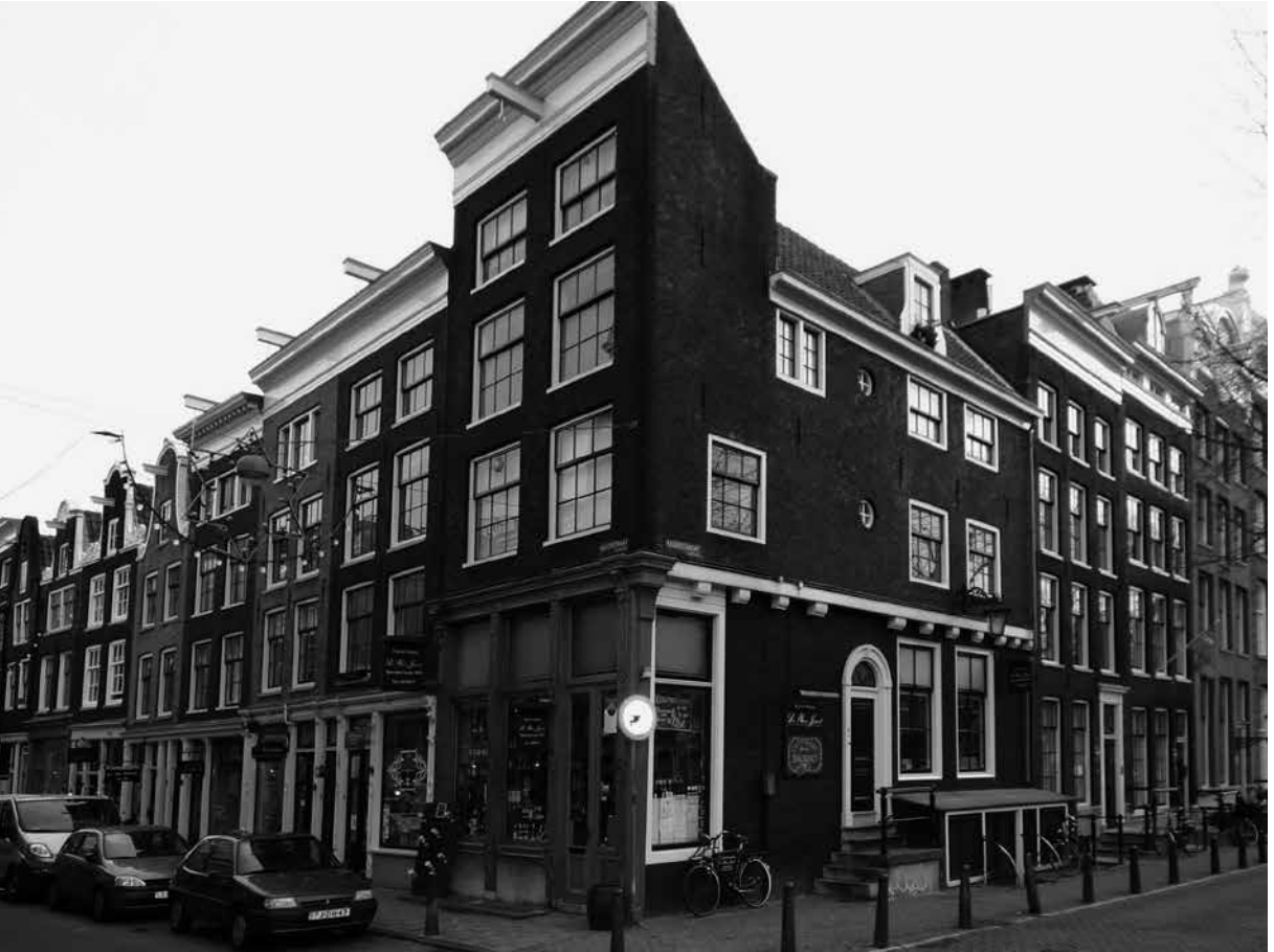
Hoek Herenstraat 31-41 en Keizersgracht in 2017.

nu alleen hebben beperkt tot de Weesperstraat en een deel van Rapenburg, aan de zuid- en westkant van de stad wel hadden plaatsgevonden, was de binnenstad veel minder een plek van 'wonen' geweest en daarmee minder leefbaar. Grote delen van de Jordaan en Bickerseiland zouden zijn verdwenen, de Vijzelstraat zou over de volledige lengte verbreed zijn en er zouden minder woonhuisgebouwen in de binnenstad zijn, de scheiding van wonen en werken zou worden door-