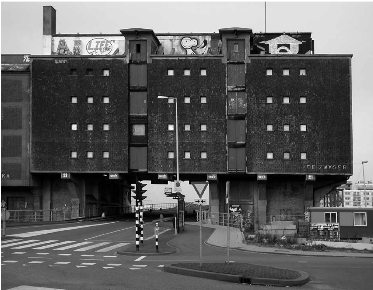
De Zwijger voor renovatie.

meer in toenemende mate de laatste keus zijn. Maar in andere landen is dit helemaal niet zo vanzelfsprekend. Als ik foto's in Zanzibar laat zien van hoe Amsterdam er vijftig jaar geleden uit zag ervaart men daar ook dat voor hun steden sloop en modernistische nieuwbouw niet de enige optie is. In andere landen zie je echt dat er een kleine elite is die vindt dat er meer moet worden behouden. We moeten alleen niet vergeten dat dat hier ook zo is geweest in de jaren vijftig en zestig. Het was toch een hoger opgeleide, enigszins cultureel vermogende groep mensen die het behoud van de binnenstad hebben gepropageerd. Zelfs de Actiegroep Nieuwmarktbuurt, de krakers, bestond uit hoogopgeleide weldenkende types. Soortgelijke actiegroepen waren actief in de Dapperbuurt en op Bickerseiland. Ik