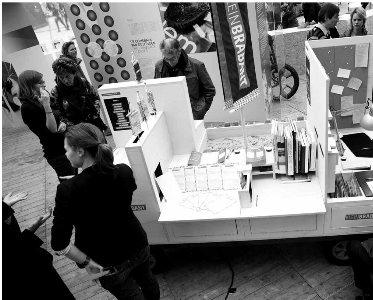
De Klein Brabant Kar

Om goed met Brabanders in gesprek te kunnen gaan, werd geprobeerd om deze abstracte vragen zo toegankelijk mogelijk te maken. Een van de concrete uitwerkingen hiervan resulteerde in een deelname aan de Dutch Design Week in Eindhoven. Daarvoor is samen met een ontwerp bureau een instrument, de Klein Brabant kar , ontworpen om op straat met