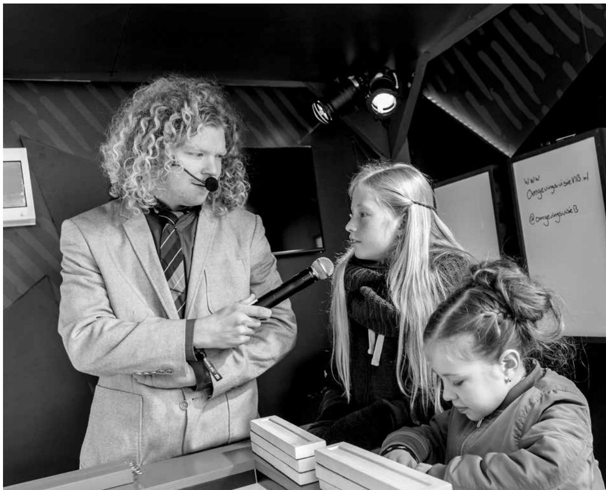
Het Rad van Participatie op de Dutch Design Week

uitkomsten van participatie een plek te geven. De kwalitatieve gesprekken met inwoners laten zich moeilijk één-op-één vertalen naar beleid. Daarom is het van belang dat de beleidsmakers en andere betrokkenen zelf de gesprekken ervaren. Op die manier krijgen de gesprekken een plek in de belevingsvorming en, misschien nog belangrijker, bij de uitvoering. Met de Brabant Pioniers is voor de Brabantse Omgevingsvisie nog een stap verder gezet. Daarbij hebben betrokken Brabanders een half jaar meegedacht en gereflecteerd op het beleid. Gedurende het proces in gesprek blijven is dus het advies, en niet alleen vooraf en achteraf. Maar ook om de verschillende betrokkenen, in dit geval collega's, gemeenten, organisaties